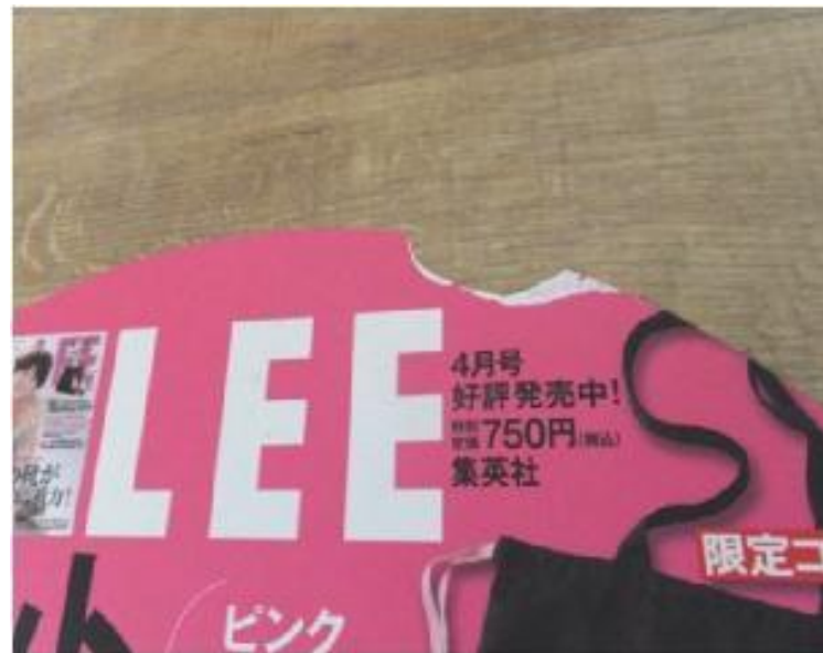
要メンテナンス例 ②