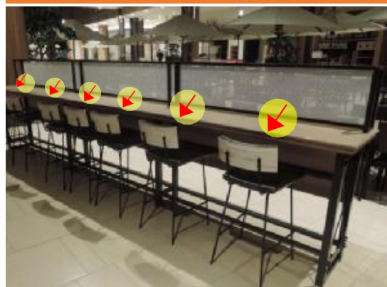
⑤カウンターテーブル

テーブルの中央に1枚貼付け。 隣り合うテーブル同士、列同士でデザインの向きを交互にする。