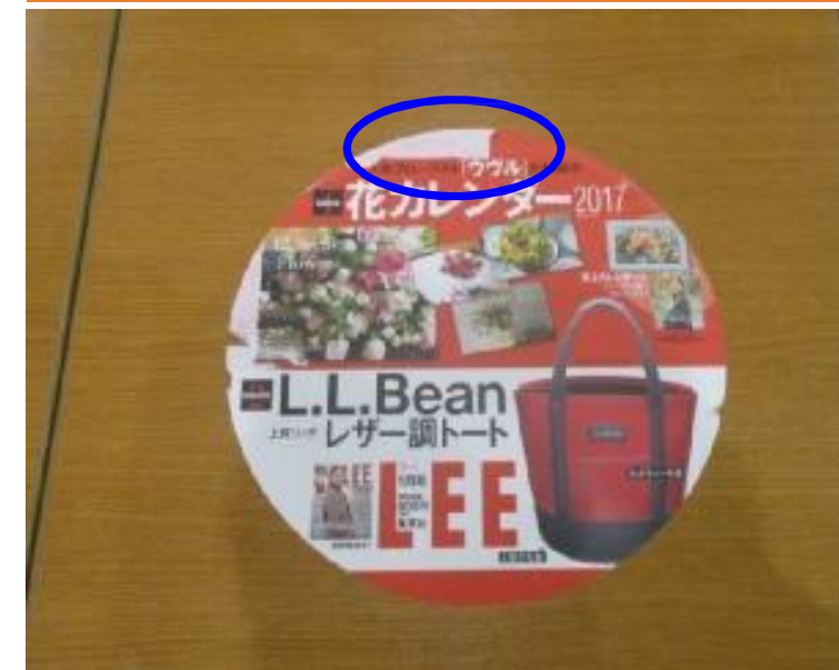
要メンテナンス例 ③