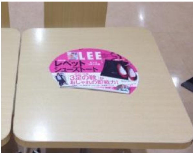
要メンテナンス例 ①

要メンテナンス例を参照に、「見栄えの悪い」・「損傷しているもの」・「汚れているもの」がございましたらメンテナンスをお願いいたします。